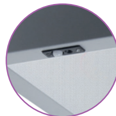
Equippée de cellule de détection automatique de présence et de luminosité Actilume DALI PHILIPS