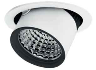
black & white