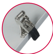
KIT de 4 clips pour fixation dans les plafonds suspendus (580x580mm)